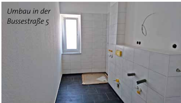
Umbau in der Bussestraße 5

Direkt neben unserem Neubau Bussestraße 6 erstrahlt auch das rundum modernisierte Nachbargebäude in neuem Glanz. Wer sich das Objekt gern von innen anschauen wollte, hatte am 24. Juli Gelegenheit dazu. Bei der Besichtigung mit unseren vorgemerkten Interessenten sorgten die modernisierten unteren Zimmer und die vier „aufgesetzten“ Neubauwohnungen für großes Interesse.