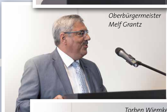
Oberbürgermeister Melf Grantz